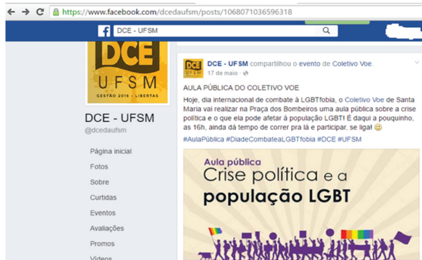
Figura 1 - Chamada para Aula pública-Coletivo Voe.